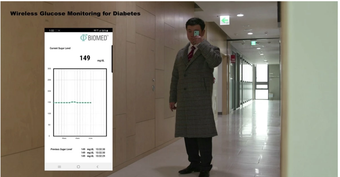
<그림> 연구자 임상시험에서 착용한 무선 구동 스마트 콘택트렌즈와 당뇨 진단 결과가 스마트폰으로 전송되는 영상의 캡처 사진

구글렌즈로 알려진 눈물 속의 당을 분석해 당뇨병을 진단하는 콘택트렌즈 기술이 이미 화제이다.